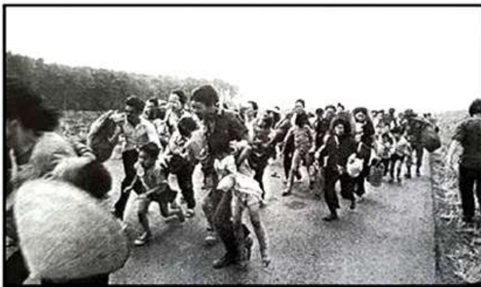
Cảnh tượng di tản

Cuộc di tản thật hỗn loạn với quá nhiều người và xe, dân và lính, kể cả súc vật. Trung Đoàn SVSQ vẫn giữ đúng kỷ luật di chuyển trong trật tự, súng M16 cầm tay sẵn sàng chiến đấu, tạo sự yên tâm cho dân chúng đi theo sau. Nhiều cụ già còn tin tưởng nhờ SVSQ mang giùm đồ đạc.