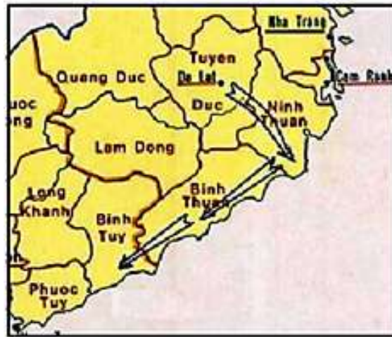
Lộ trình di tản của TVBQGVN

Kết quả cuộc họp là Trường phải di tản để bảo toàn lực lượng. Cuộc hành quân bắt đầu ngày 30/03/1975. Theo kế hoạch sơ khởi, Trường băng rừng đến Phan Rang, nhưng vì lộ trình quá hiểm trở và bất an trong khi SVSQ phải mang theo nhiều quân trang quân dụng, vũ khí đạn dược cần thiết, nên một kế hoạch khác được chọn là: Di chuyển bằng quân xa do SVSQ mở đường, phối hợp cùng lực lượng địa phương của Tiểu Khu Tuyên Đức.